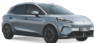
● STŘÍBRNÁ MEDAL METALICKÝ LAK 16 500 Kč