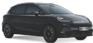
● ČERNÁ PEBBLE METALICKÝ LAK 16 500 Kč