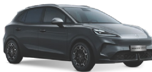
● ŠEDÁ ANDES METALICKÝ LAK 16 500 Kč