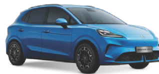
● MODRÁ BRIGHTON NEMETALICKÝ LAK 16 500 Kč