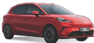
● ČERVENÁ DIAMOND METALICKÝ LAK 16 500 Kč