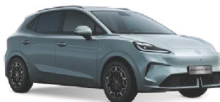
● MODRÁ CYAN METALICKÝ LAK 16 500 Kč