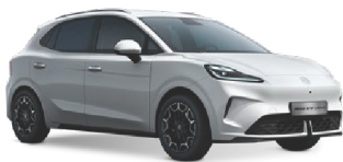
○ BÍLÁ DOVER ZÁKLADNÍ LAK